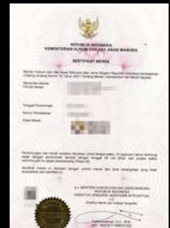
Merk Dagang : Rumah kopi Institute