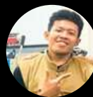
ADHIS BARISTA COMPETEN BNSP INSTRUKTUR 2