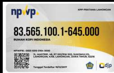
NPWP Pajak PT : 83.565.100.1-645.000