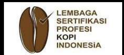
Nomor Met Asesor : MET. 000.007545 2024