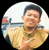
ADHIS BARISTA COMPETEN BNSP INSTRUKTUR 2