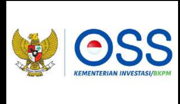
Nomor Ijin Berusaha (NIB) OSS: 8120318042636