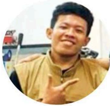
ALDIS Barista Competen BNSP Instruktur 2