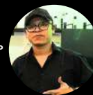
NAYEK BARISTA COMPETEN BNSP INSTRUKTUR 3