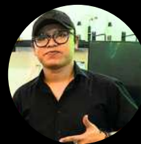
NAYEK BARISTA COMPETEN BNSP INSTRUKTUR 3