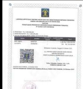
SK Kemenhukam : AHU-0061305.AH.01.02 THN 2023