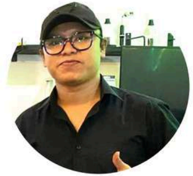
NAYEK Barista Competen BNSP Instruktur 3