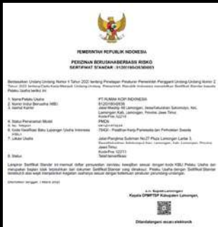
No Serifikat LPK : 81203180426360003