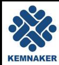
No Kelembagaan Kemnaker RI : 1909352401