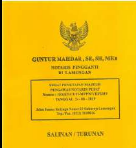
Akta PT Turunan Notaris Pengganti Guntur Mahdar, SE, SH, Mkn No : 01 Tanggal 10 Oktober 2023