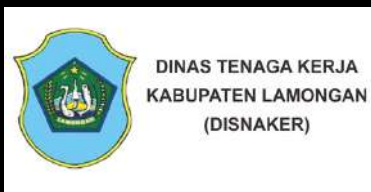
No Ijin LPKS Disnaker : 188/70/KEP/413.116/2024