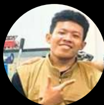
ADHIS BARISTA COMPETEN BNSP INSTRUKTUR 2